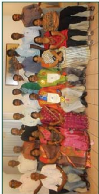
சப்போ நிழல்கிகள் நிறுவனத்தின் முத்தமிழ்ப் பாவல் மன்றம் ஏற்பாடு செய்து விருந்தளித்து வழங்கிய விழாவிൽ பாவலர்களுடன்