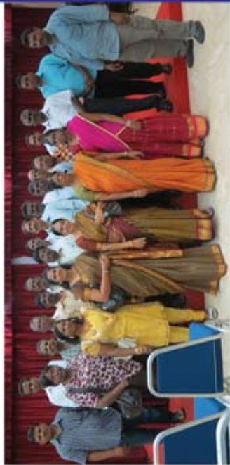
கோலாலம்பூரில் நடந்த கவிஞர் குழு நூல் வெளியீட்டு விழா முடிவில் தமிழன்பர்களுடன்